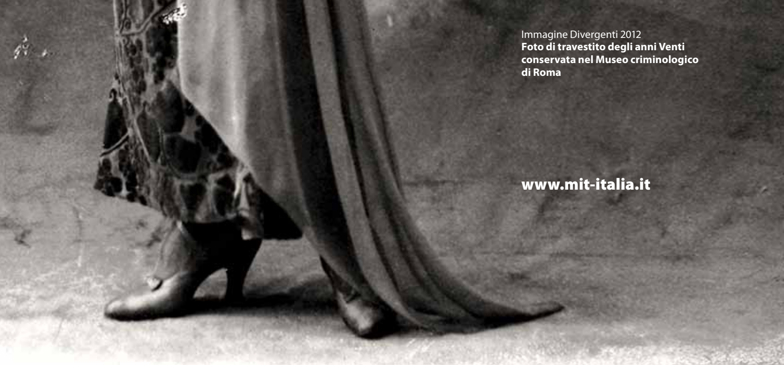
Immagine Divergenti 2012

Foto di travestito degli anni Venti conservata nel Museo criminologico di Roma